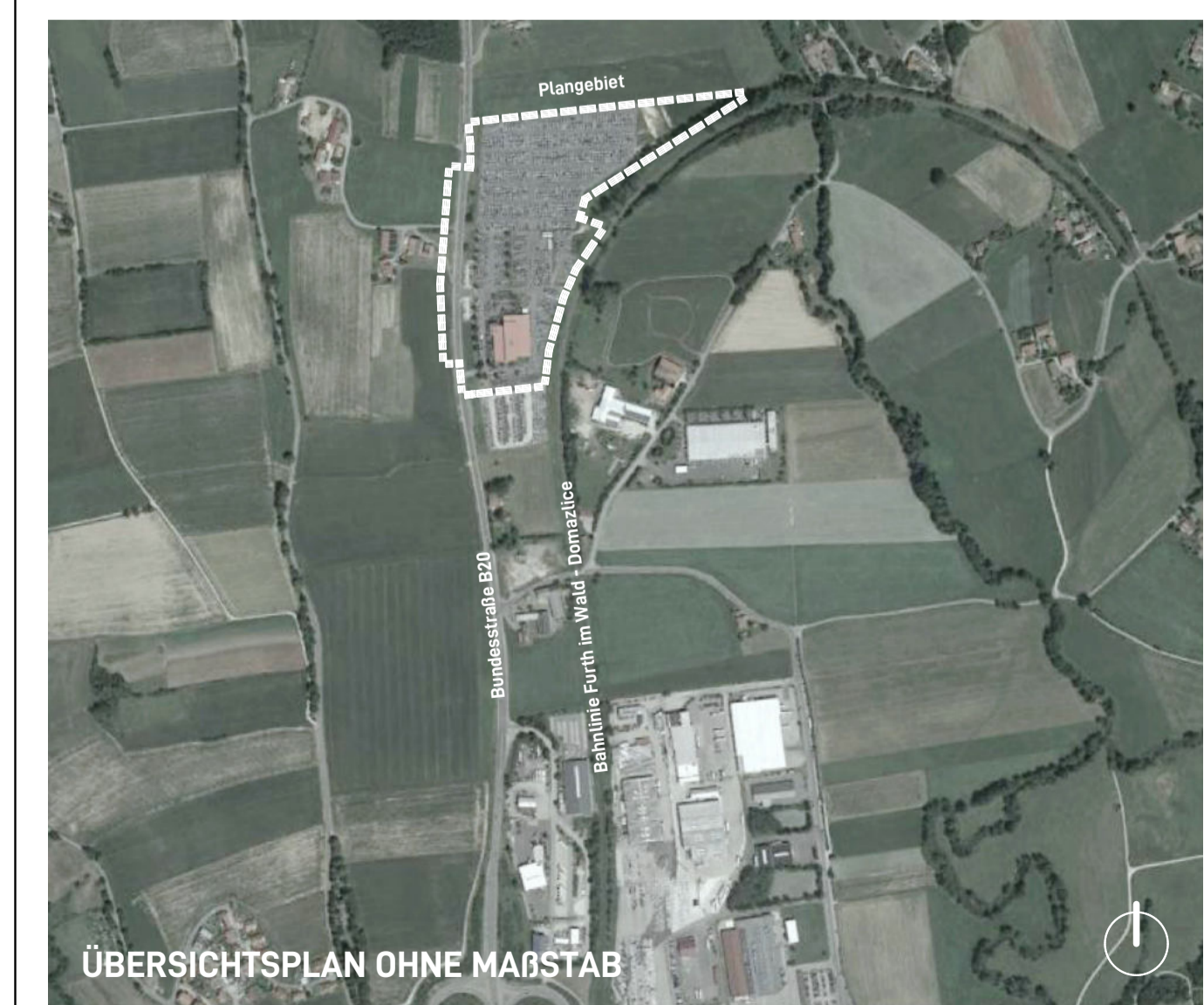
ÜBERSICHTSPAN OHNE MAßSTAB

STADT FURTH IM WALD LANDKREIS CHAM REGIERUNGSBEZIRK OBERPALZ