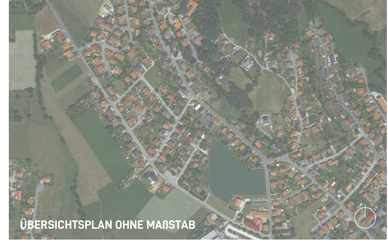
ÜBERSICHTSPLAN OHNE MAßSTAB

PH2 ARCHITEKTUR + STADTPLANUNG LEMINGER STR. 11 - 93458 ESCHLICKAM T +49 (0) 9948/73990-00 E info@ph2architektur.com www.ph2architektur.com